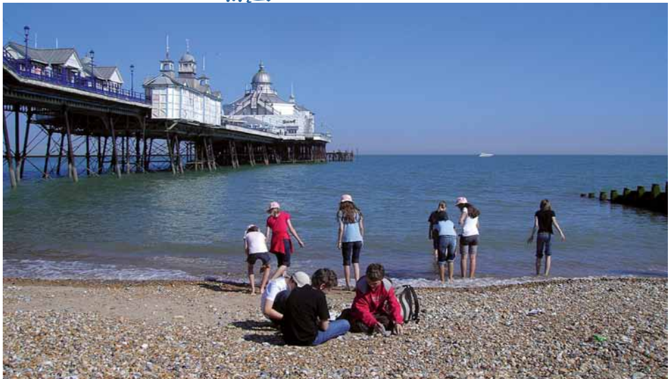
Klassenfahrt nach Eastbourne in der 7. Klasse