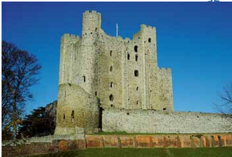
Besuch von Rochester Castle im Rahmen des Chatham-Austauschs

Schon in wenigen Jahren wirst du in der Lage sein, dich in den meisten Teilen der Welt verständlich zu machen. Ein bisschen probieren wir das auch während der Schulzeit schon aus, denn den Schülern ab der 8. Klasse werden verschiedene Möglichkeiten angeboten, ihre Sprachkenntnisse in England und Frankreich anzuwenden. Wir sind mit zwei Schulen in England und je einer Schule in Frankreich, in der Schweiz und in Indien befreundet.