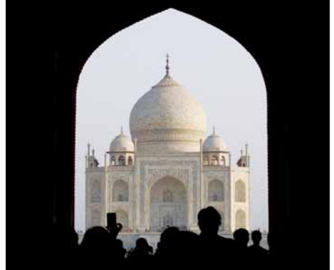
Besuch des Taj-Mahal im Rahmen des Indien-Austauschs

Schon in wenigen Jahren wirst du in der Lage sein, dich in den meisten Teilen der Welt verständlich zu machen. Ein bisschen probieren wir das auch während der Schulzeit schon aus, denn den Schülern ab der 8. Klasse werden verschiedene Möglichkeiten angeboten, ihre Sprachkenntnisse in England und Frankreich anzuwenden. Wir sind mit zwei Schulen in England und je einer Schule in Frankreich, in der Schweiz und in Indien befreundet.